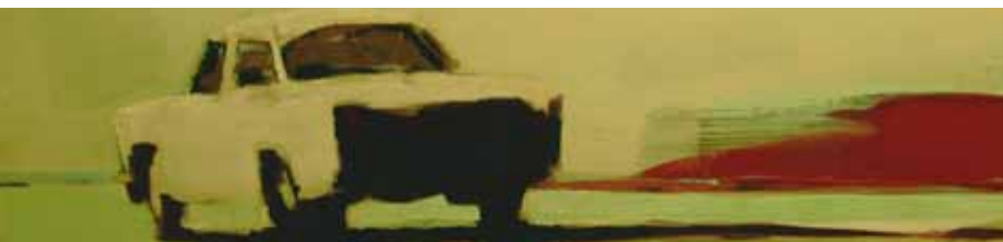
Detalj: Den gamle bilen og havet

Litteratursymposiets storslåtte opningsforestilling. Sjå eige oppslag s. 8.